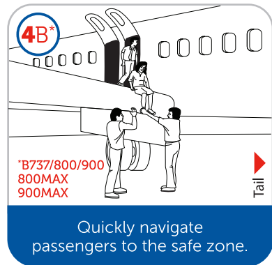
Quickly navigate passengers to the safe zone.