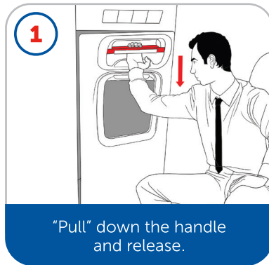
"Pull" down the handle and release.