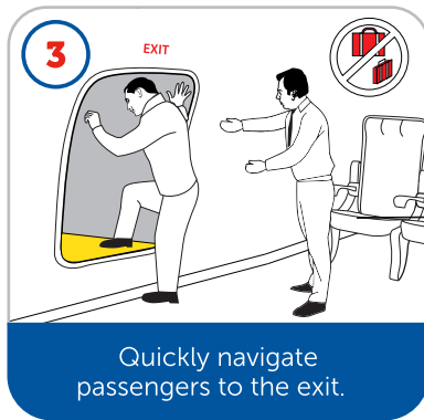
Quickly navigate passengers to the exit.