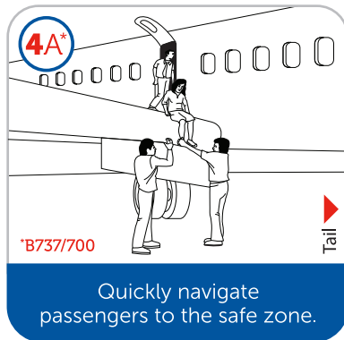
Quickly navigate passengers to the safe zone.